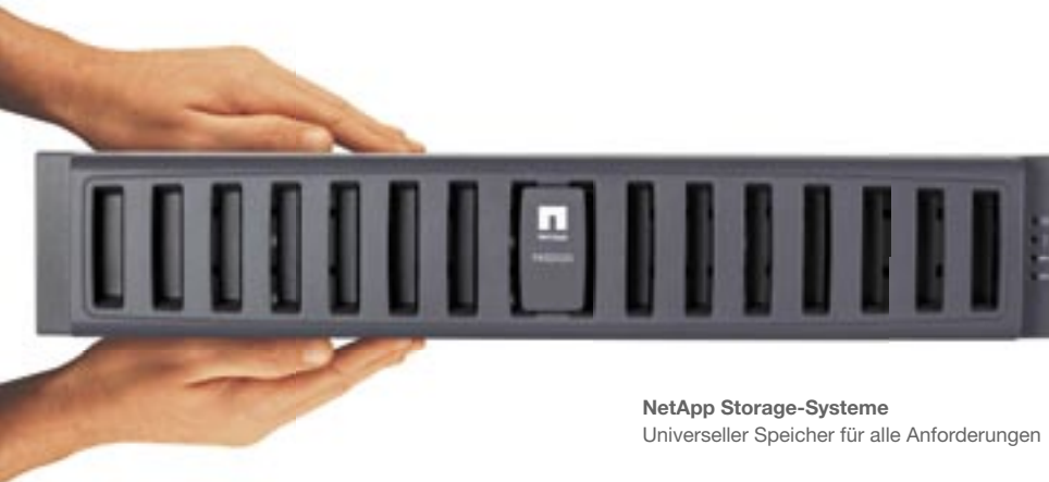
NetApp Storage-Systeme Universeller Speicher für alle Anforderungen

Ein weiterer großer Pluspunkt liegt in der Flexibilität: Die NetApp FAS2000-Systeme lassen sich als Primär- und Sekundärspeicher gleichermaßen einsetzen, bedienen Block- oder File-Daten über Fibre Channel und Ethernet. Das bedeutet: Mit einer einzigen Lösung für CIFS, NFS, iSCSI und FC SAN sind Sie für alle Anforderungen gewappnet. FAS2000-Systeme bieten integrierten Zugriff auf Block- und File-Ebene, intelligente Management-Software und Datensicherheit. Die Systeme umfassen Unterstützung für kostengünstige SAS-Laufwerke, flexible I/O-Konnektivität und Remote-Management. Das Betriebssystem Data ONTAP 7G steigert zudem die Speichereffizienz durch höhere Kapazitätsauslastung und Thin Provisioning. Dank der Snapshot-Technologie benötigen Sie zudem nur noch Sekunden oder Minuten statt Stunden und Tage für ein Backup – so reicht auch das knappste Zeitfenster, um Ihre Unternehmensdaten perfekt zu sichern.